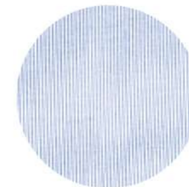
MIL RAYAS CELESTE